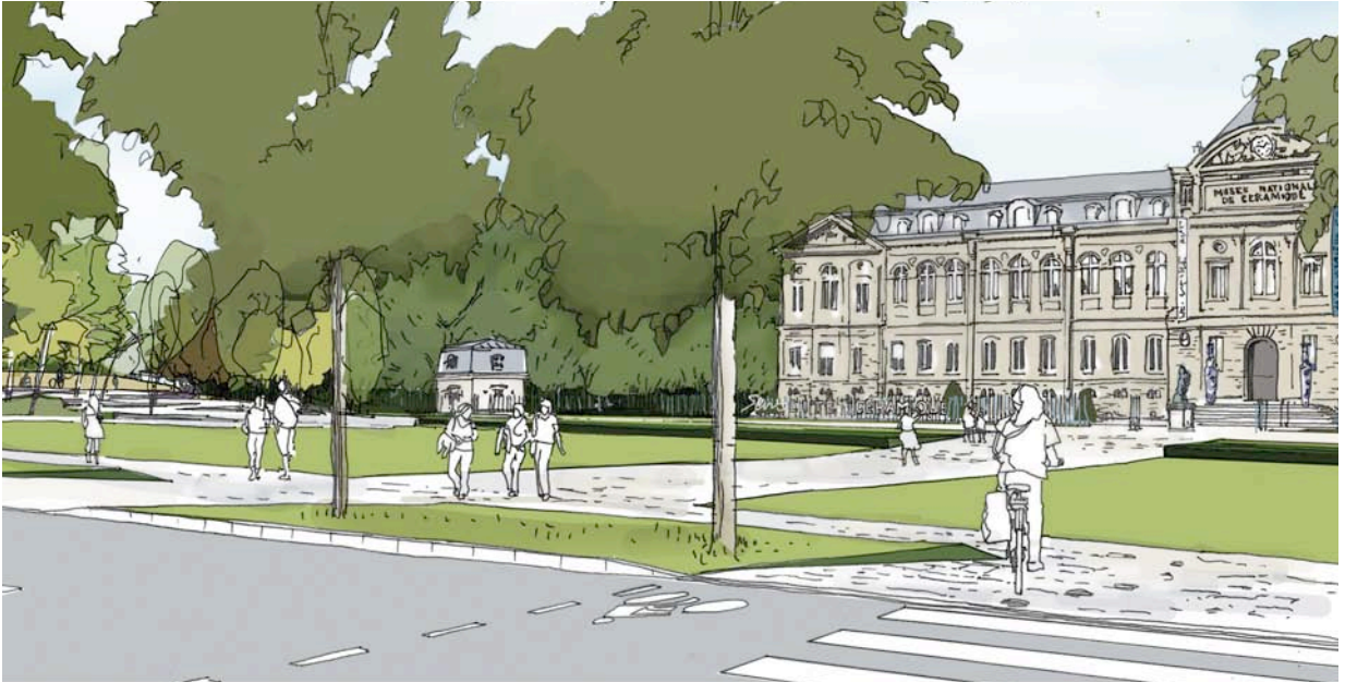
Création d'un grand mail devant la Cité de la céramique.