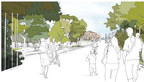
Perspectives d'aménagement au débouché du pont de Sèvres.

Concertation préalable du lundi 4 mars au mardi 5 avril Exposition dans la Gare tramway T2 Musée-de-Sèvres Réunion publique le mardi 26 mars à 20 h Parc nautique de l'Île de Monsieur