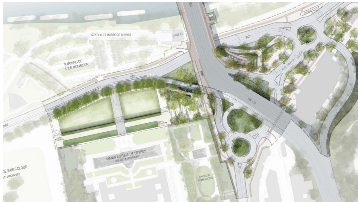
Les perspectives d'aménagement et la mise en valeur de la Cité de la céramique.