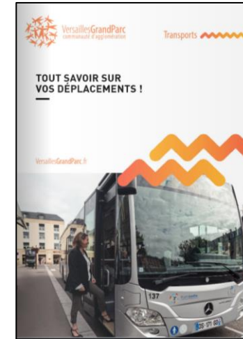
Newsletter salariés Guide pratique mobilité