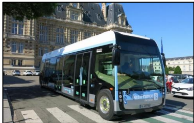
Bus 100% électrique Aptis

Offre de bus renforcée – Qualité du service – Informations voyageurs